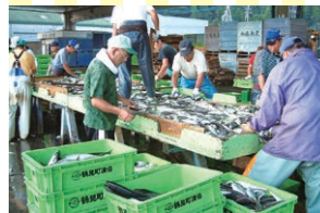
まき網水揚げの様子

淡白でクセのないアジ。実は、うまみ成分のイノシン酸が豊富なお魚。刺身、から揚げ、干物などさまざまな料理に使用して、とつても万能です! 大分市民のアジへの支出は長崎市、宮崎市、松江市について全国4位(※)! かなりのアジ好き県と言えますね。関あじをとる一本釣りのほかに、佐伯市鶴見などでは「まき網漁業」も盛んです。