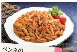
ペネのミートソース炒め