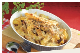
とろ〜りチーズの牛肉ポテト

「パパッとくん」はカットした食材と調味料がセットになった、コニブおおいのオリジナルの食材セットです。コニブの宅配カタログ「食べちゃくれ! おおいだ」またはインターネット注文「eフレンズ九州」から注文できます。