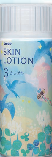
コープ スキンローション (さっぱり)