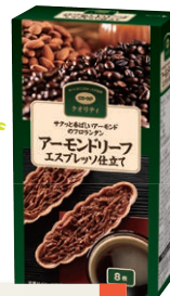
アーモンドリーフ エスプレッソ仕立て

コーヒー風味に仕上げたキャラメルは、アーモンドと相性抜群。アーモンド+キャラメル+コーヒーのバランスにこだわり、何度も試作を繰り返した自慢のお菓子です。