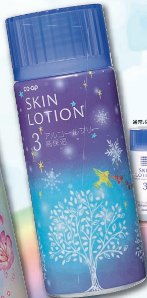
コープ スキンローション (アルコールフリー 高保湿)