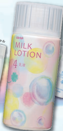
コープ ミルクローション