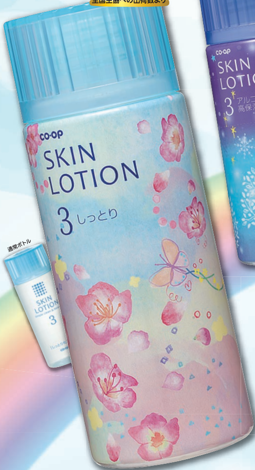
コープ スキンローション (しっとり)