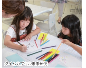
タイムカプセル未来郵便

※参加される方は、事前申し込みのご協力をお願い致します。事前申し込みされた方には、試食体験無料チケットをお送りします。※VR体験できる参加者(計13名)は、上記の時間でVR体験コーナーにいる希望者の中から当日会場内で抽選いたします。体験者が見ている映像は、モニターで見る事ができます。