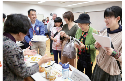
▲写真はイメージです。集会室で行なわれる試食交流はブース形式で交流します。