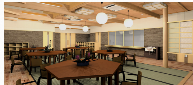
デイサービスセンターにじいろ2号館 (通所介護事業所)

敷地内には、様々な福祉サービスがそろっています。支援が必要になっても安心です。また地域交流室を併設しており、スタッフやご家族様、地域の組合員、住民、ボランティアの方とふれあいの場を提供します。