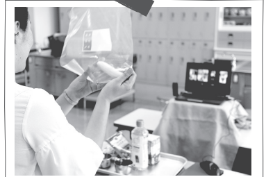
オンライン料理教室の様子