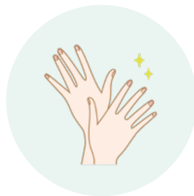
マニキュア・ ジェルネイル