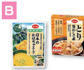
B 日本のかぼちゃスープ& とり釜めしの素