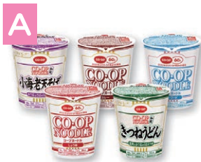
A コープヌードルシリーズ (5個セット)