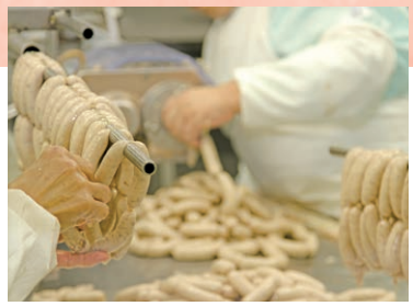
天然の羊腸を使用することで、パリッとした食感が生まれます。

美味しく食べるポイントは「加熱しすぎないこと」です。ポイルは沸騰しない程度の温度で湯がき、焼く時は弱火～中火で焼き目が付くまで転がしながら焼いてください。