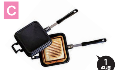
C ホットサンドメーカー