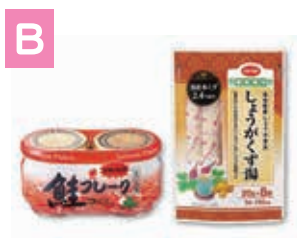
鮭フレーク& しょうがくず湯セット