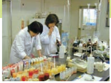
原料、調合液、充填後の3段階で、甘さや酸味を数値化する理化学検査と、五感を使った官能検査が行われています。

にんじんはしっかり湯通しすることで、独特のえくみが消えてまろやかに。湯通しした後、漬して搾汁し、濃縮の工程で水分が蒸発する時ににんじん独特の臭みが取り除かれるので、さらに飲みやすくなります。