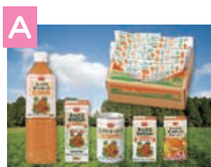
ミックスキャロット コンプリートセット