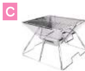
アウトドア用 焚き火台 (奥行31cm×幅31cm×高さ20cm)