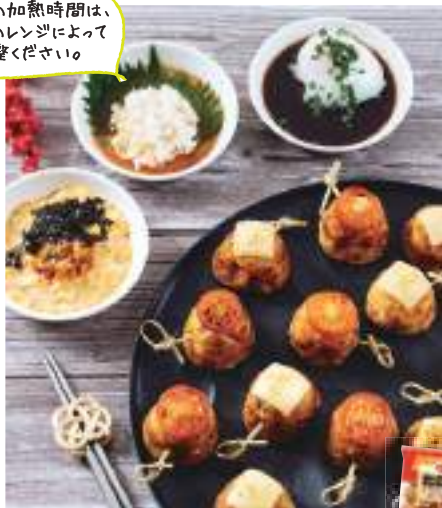
1人あたりのカロリー 321kcal・塩分2.9g