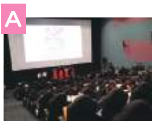
T・ジョイ パークプレイス大分で使える! 映画鑑賞券(3,000円分)