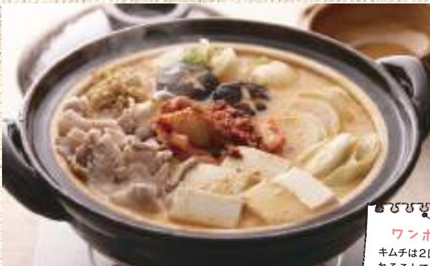
1人あたりのカロリーー 477kcal・塩分2.9g