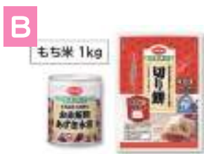
お赤飯用あずき水煮& もち米&切り餅セット