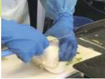
白菜を塩漬けして水洗いした後、傷や斑点を包丁で取り除いています。

また、日本人好みの味に仕上げているのも人気の理由です。キムチは発酵食品なので、時間が経つと発酵が進んで酸味が増してきます。日本人はこの酸味をあまり好まないことから、ヤンニョムの配合を工夫して発酵を抑えるようにしているそうです。それでも発酵は進みますが、110gと小容量なので早めに食べられるのもうれしいポイントで