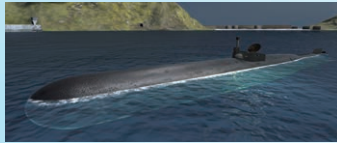
人間魚雷「回天」の VR画像