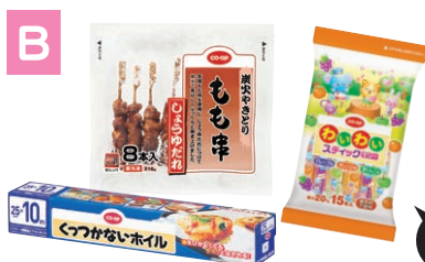
炭火やきとりもも串(しょうゆだれ)、 わいわいスティックゼリー、 くつつかないホイイル