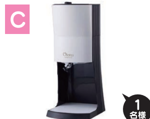
電動ふわふわ かき氷機