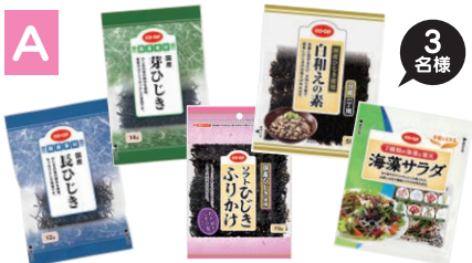
(株)山忠 製造 コープ商品セット