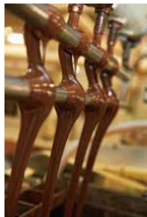
冷やして温める「調温」により結晶が安定し、なめらかになって艶が出ます。

工場では、3つの主原料にミルクや砂糖などを混ぜ合わせる工程から製造がスタート。微粒化(なめらかにする)、精練(練り上げる)、調温(テンパリング)の後、型に充填され、