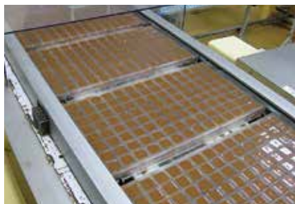
型の四隅までチョコレートが行きわたるように、2回に分けて充填しています。

チョコレートは温度による影響を受けやすいので、製造においては温度管理がとても重要です。『(株)正栄デリシイ』では、製造工程ごとに温度管理を徹底し、必ず人による味の確認(官能検査)を行って、次の工程に送っています。官能検査は厳しい試験をクリアした、繊細な味覚の持ち主しか行うことができません。たくさんの複雑な工程と厳しい品質管理を経て、ファミチョコが出来上がっています。