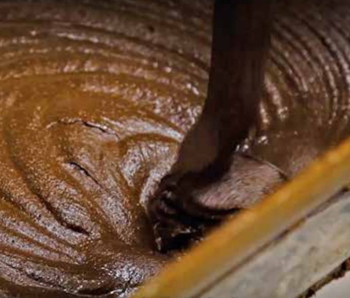
原料をローラーにかけて押しつぶし、ザラつきを取り除く「微粒化」の工程。