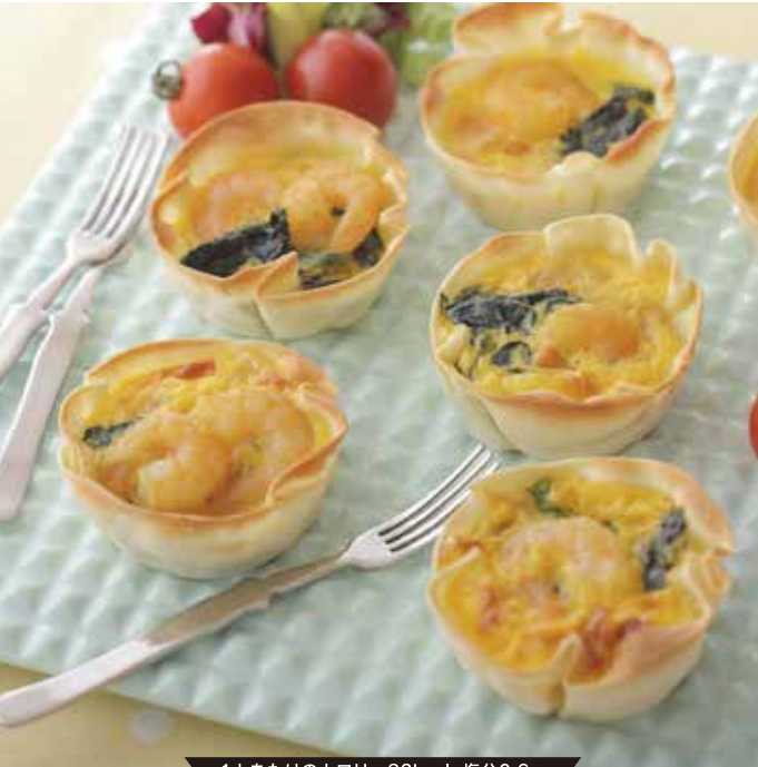
1人あたりのカロリー83kcal・塩分0.6g