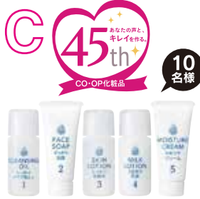
コープ基礎化粧品 トライアルセット