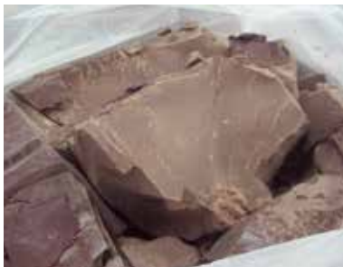
写真はカカオ豆をすりつぶしたカカオマス。ファミチヨコには、複数の産地のカカオ豆が使用されている。