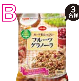
オーツ麦たっぷり フルーツグラノーラ