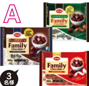
ファミリーチョコレート 3種セット