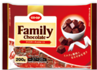
ファミリーチョコレート