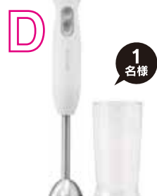
ハンドブレンダー