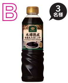
木樽熟成 特選丸大豆しょうゆ