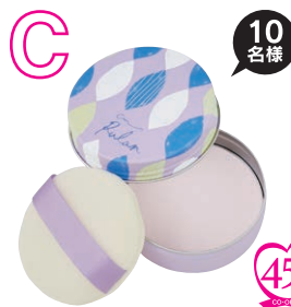
ルランホワイトニング 美肌パウダー