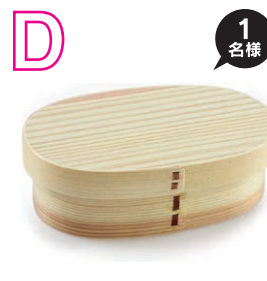
曲げわっぱ弁当箱