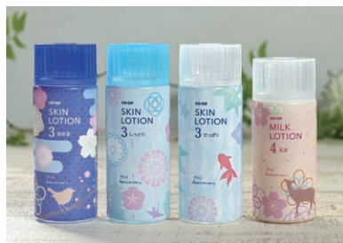
左から、スキンローション高保湿タイプ、しっとりタイプ、さっぱりタイプ、ミルクローション(乳液)

組合員さんの声に応え、想いをかたちにしたコープ化粧品は、誕生から45周年。そんな節目となる今年、コープ化粧品の第1号商品である、「コープ基礎シリーズ」の限定デザインボトルが登場します! デザインは組合員さんの投票によって選ばれたものです。