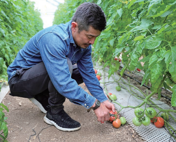
茎を固定したワイヤーをすらしながら栽培していくと、地面に近い位置で収穫期を迎えるので、収穫は腰をかかめて行うことになる。