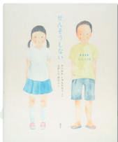
絵: 江頭路子 文: 谷川俊太郎