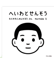
絵: Noritake 文: 谷川俊太郎