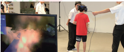
前回の体験時の様子

VR体験は一人10分程度で完全予約制です。体験希望の方は申込フォームよりご応募ください。