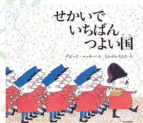
作・絵: デビッド・マッキー 訳: なかがわちひろ

「せかいでいちばんつよい国」「せんそうしない」「へいわとせんそう」の3冊です。おとなからお子さんまで聞き入ってしまう作品です。