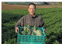
赤峯農園 (春ごぼう)