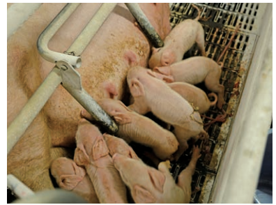
お母さん豚と赤ちゃん豚は、分娩舎で24日間一緒に過ごします。

の体の周りに付いた膜をはがし、 体温が低下しないように濡れた 体にパウダーをまぶします。赤 ちゃんは自力でお母さん豚のお っぱいを探し、一生懸命お乳を 飲んでいました。