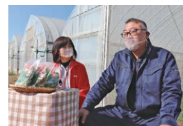
(株)安心院オーガニックファーム (ヘビーリーフ)