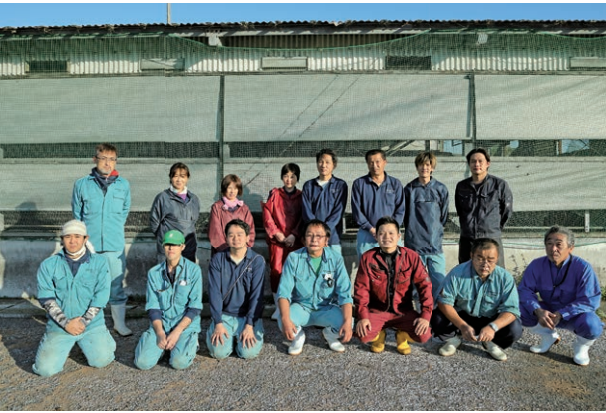
『安岐農場』の従業員のみなさん。それぞれが担当する豚舎の豚たちを世話しています。

豚舎は、離乳後の母豚を休 ませて種付けをする休息舎、 妊娠した母豚が過ごす妊娠舎、 母豚が出産して子豚と過ごす 分娩舎、離乳舎、子豚舎、肥 育舎と細やかに分けられてい ます。取材にうかがった日、 ちょうど出産中のお母さん豚 と赤ちゃんに出会うことができ ました。赤ちゃんが産まれ ると、担当スタッフが赤ちゃん