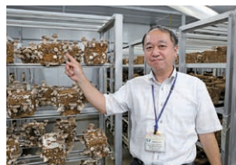
(株)ハートコープおおいた (しいたけ)