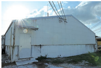
SPF豚認定農場として、毎年厳しい認定審査をクリアしています。

コープおいたの『産直豚肉』は、大分県内の五つの産直生産者によって育てられています。今回うかがったのは、『JA北九州ファーム株式会社』が運営する国東市の『安岐農場』。『産直豚肉』のほとんどを生産し、母豚約900頭、子豚約1万500頭を、16名の従業員で管理している大規