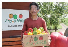
(有)ベストクローブ(はしもと農園) (パプリカ)