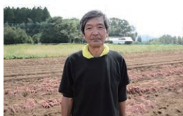
(株)夢ファームおおいた (プロッコリー)