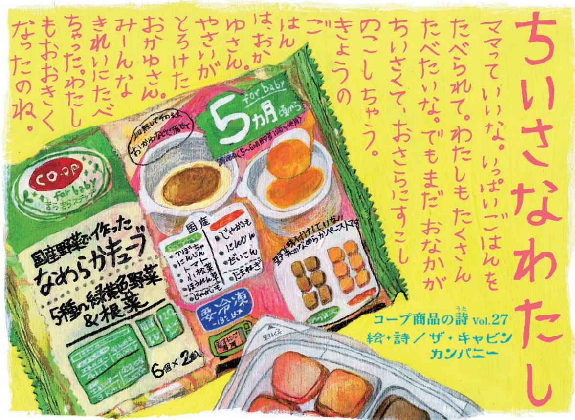
コープ商品の詩 Vol.27 絵・詩 / ザ・キャビン カンパニー