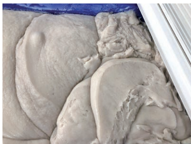
主原料のスケソウダラのすり身に液体調味料を 加えてかくはんしたペースト

味も見た目もカニの身に似せてつくられたカニカマは、美味しさ、食べやすさ、買いやすさから人気が広まり、ひとつの食品ジャンルとして成長を遂げられました。高たんぱく低カロリーであることも手伝って、その人気は世界にも広まり、日本が世界に誇る食文化のひとつとなっています。