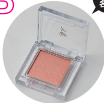
クラブコスメチックス コンパクトアイシャドウ (ロゼベージュ)