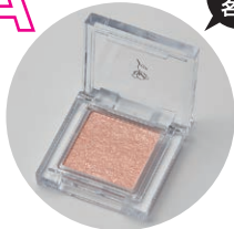
クラブコスメチックス コンパクトアイシャドウ (パールブルー)