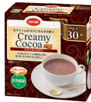
クリーミーココア